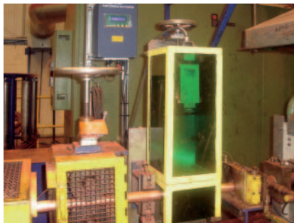
Zwei der bei Mueller Copper Tube in Bilston (England) installierten optischen LSV-Sensoren für die Zuschnittsteuerung