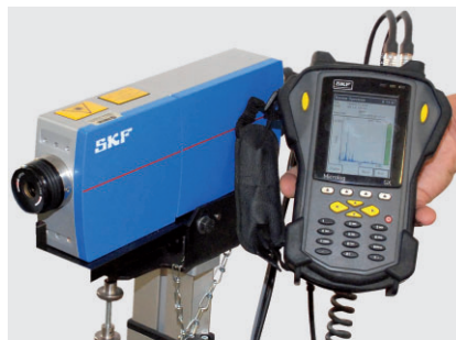
Bild 3: Mobile Systemlösung mit SKF Laservibrometer und SKF Microlog